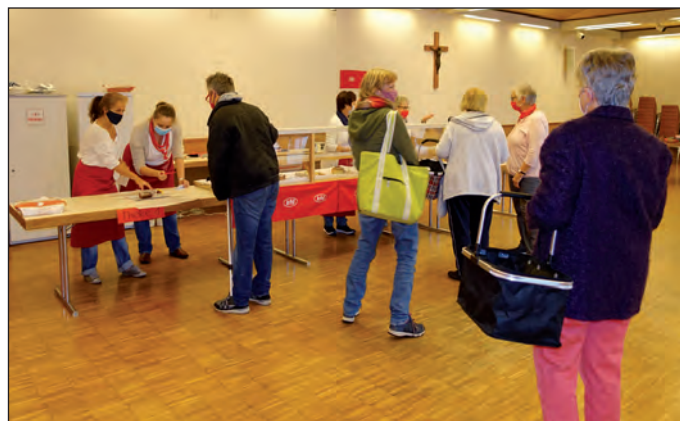
Schlange stehen für den Erntedank-Nachmittagskaffee

„Hilft. Wenn viele mitmachen!“ – so könnte man unsere Aktion am vergangenen Feiertagssamstag überschreiben. Zum Erntedankfest boten wir, die Frauengemeinschaft Ersingen, Kuchenpäckchen zum Mitnehmen im Bernhardusheim Ersingen an. Fast 30 Kuchen wurden innerhalb einer Stunde angeliefert, um dann wiederum innerhalb der zwei Folgestunden verkauft zu werden.