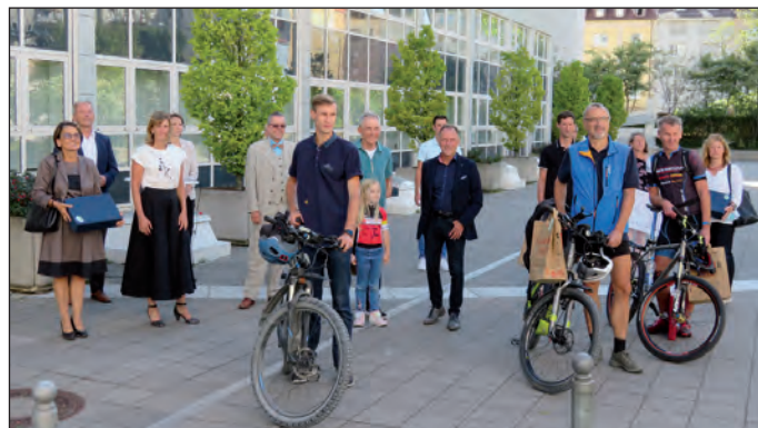
Die Radlerinnen und Radler aus dem Enzkreis und den Enzkreis-Kommunen Birkenfeld, Königsbach-Stein, Maulbronn, Mühlacker und Niefern-Öschelbronn haben beim diesjährigen STADTRADELN das Vorjahres-Ergebnis mehr als verdoppelt. (enz)

Im Vergleich aller 1.457 teilnehmenden Kommunen liegt der Enzkreis bei der Gesamtfahrleistung derzeit auf Platz 72 und in Baden-Württemberg auf Platz 19; im Ländle nehmen bislang 343 Kommunen teil. Allerdings müssen sich manche davon erst noch aufs Rad schwingen, darunter starke Großstädte wie Tübingen oder Landkreise wie der Landkreis Reutlingen. Ende des Jahres liegen die Resultate im Gesamtwettbewerb vor. (enz)