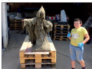
Beim Kurs Betonfiguren bauen im Bauhof Remchingen

Neue Kurse für Musikalische Früherziehung ab Oktober 2020: Bitte beachten Sie unsere aktuellen Informationen auf unserer Homepage.