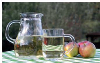
Leckerles von der Streuobstwiese: Apfelmost. (enz)