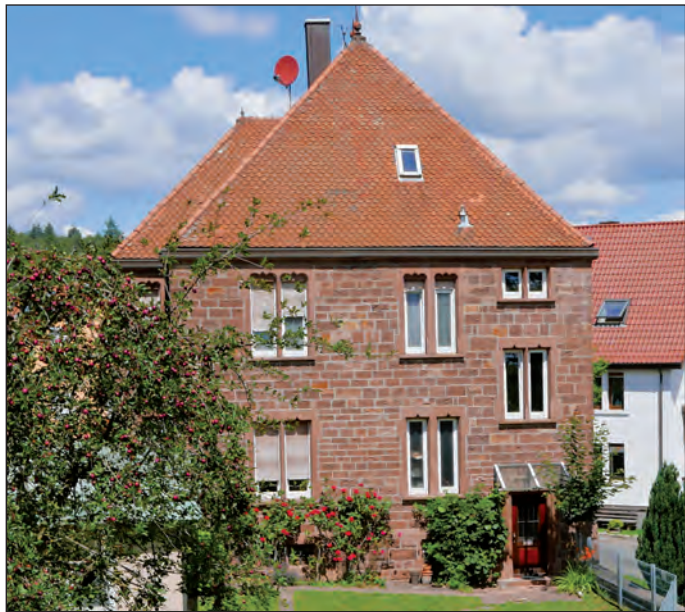
Im Bilfinger Pfarrhaus an der Ebbstraße werden ab dem 13. Juli bis gegen Ende nächsten Jahrs die Rathausgeschäfte wahrgenommen.