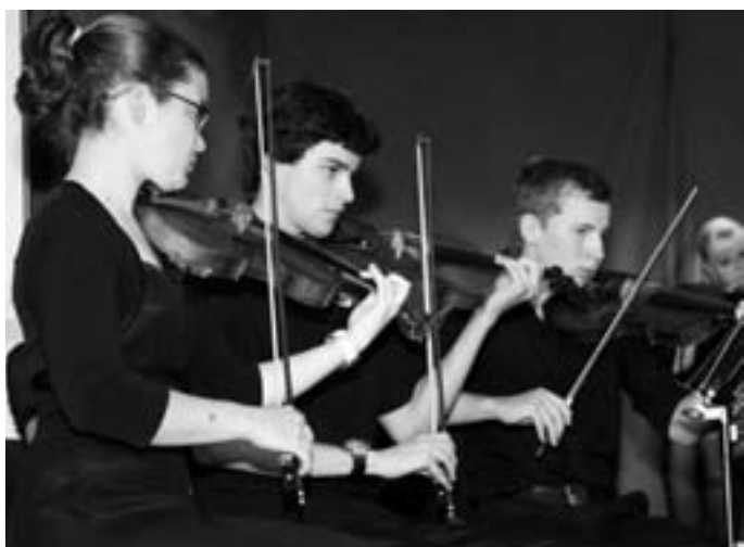
Die Streicherklassen und das „Ensemble Classico“ gestalteten in der Aula des Bildungszentrums Königsbach einen beeindruckenden musikalischen Abend als letzte öffentliche Veranstaltung in diesem Schuljahr