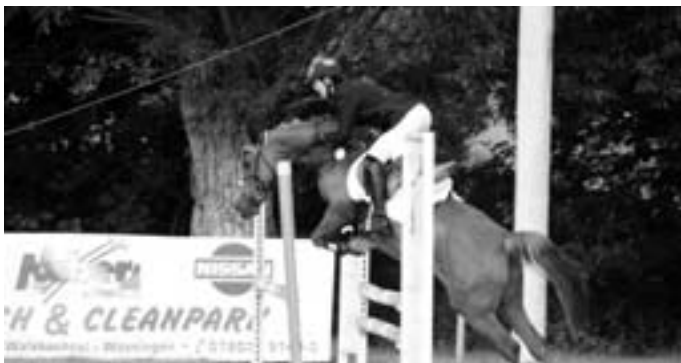
Nur Fliegen ist schöner

Leider wird es durch die hohe Zahl der Teilnehmer zu einem erhöhten Aufkommen von an- und abfahrenden LKW's und Pferdeanhängern kommen. Für etwaige Unannehmlichkeiten während der drei Tage möchten wir uns schon jetzt entschuldigen und um Verständnis bitten.