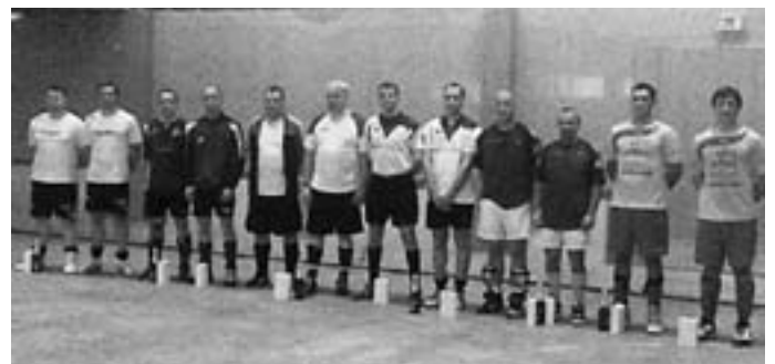
Die Mannschaften von links nach rechts: RSV Wendlingen, VFL Sindelfingen, RMSC Ölbronn, RKV Leimen, RMSV Ersingen, RKV Rheinstetten

Es waren durchaus ansehbare Spiele dabei, welche vielleicht schon einen Vorgeschmack auf die kommende Landesligasaison geben könnten.