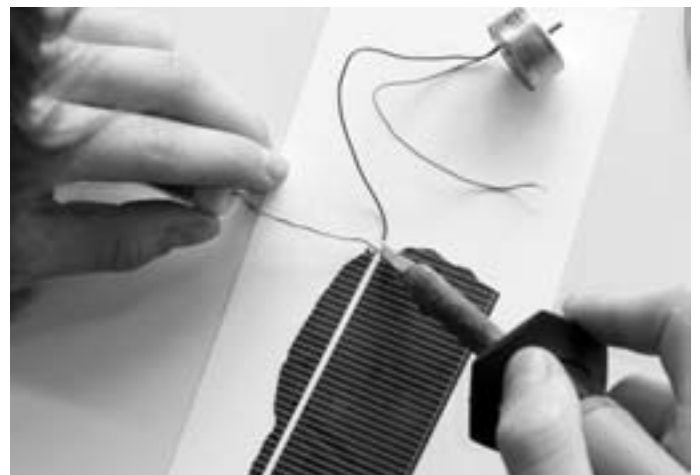
Mit Solarzellenbruchstücken und einem Elektromotor lässt sich die Energie der Sonne demonstrieren.