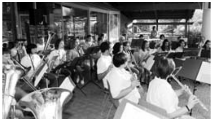
Unter dem Vordach der Grundschule hatten die Musiker Platz genommen. Text und Fotos: Schott