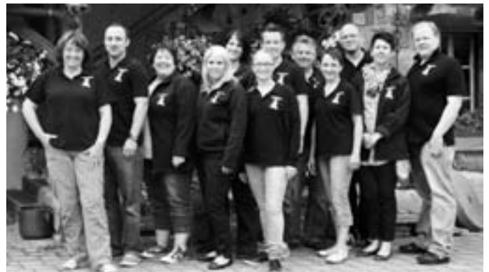
Alle Teilnehmer des Kakaduseminars 2012

Die Verwaltungs-Mitglieder des NKB trafen sich am 02.06.2012 pünktlich um 9 Uhr zur Abfahrt zum diesjährigen Tages-Seminar.