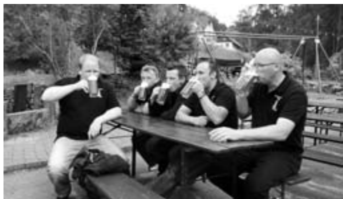
Prost, gschafft hemmers